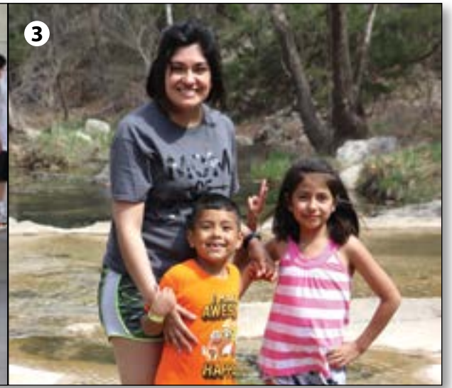
1) Durante las mananas, los niños participaron en la Escuela Bíblica de Vacaciones; 2) Los jóvenes participaron en juegos de equipo; 3) Las familias visitaron Boulder Springs y otras áreas populares de Falls Creek durante el tiempo de recreación.

>> Por Ever Borunda Estratega de Ministerios Hispanos