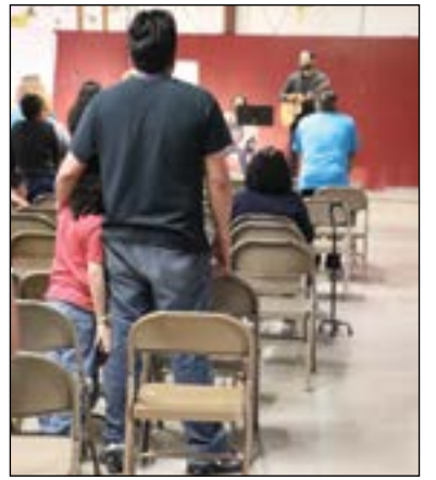
PAGINA | 4 Campamento Familiar 2018